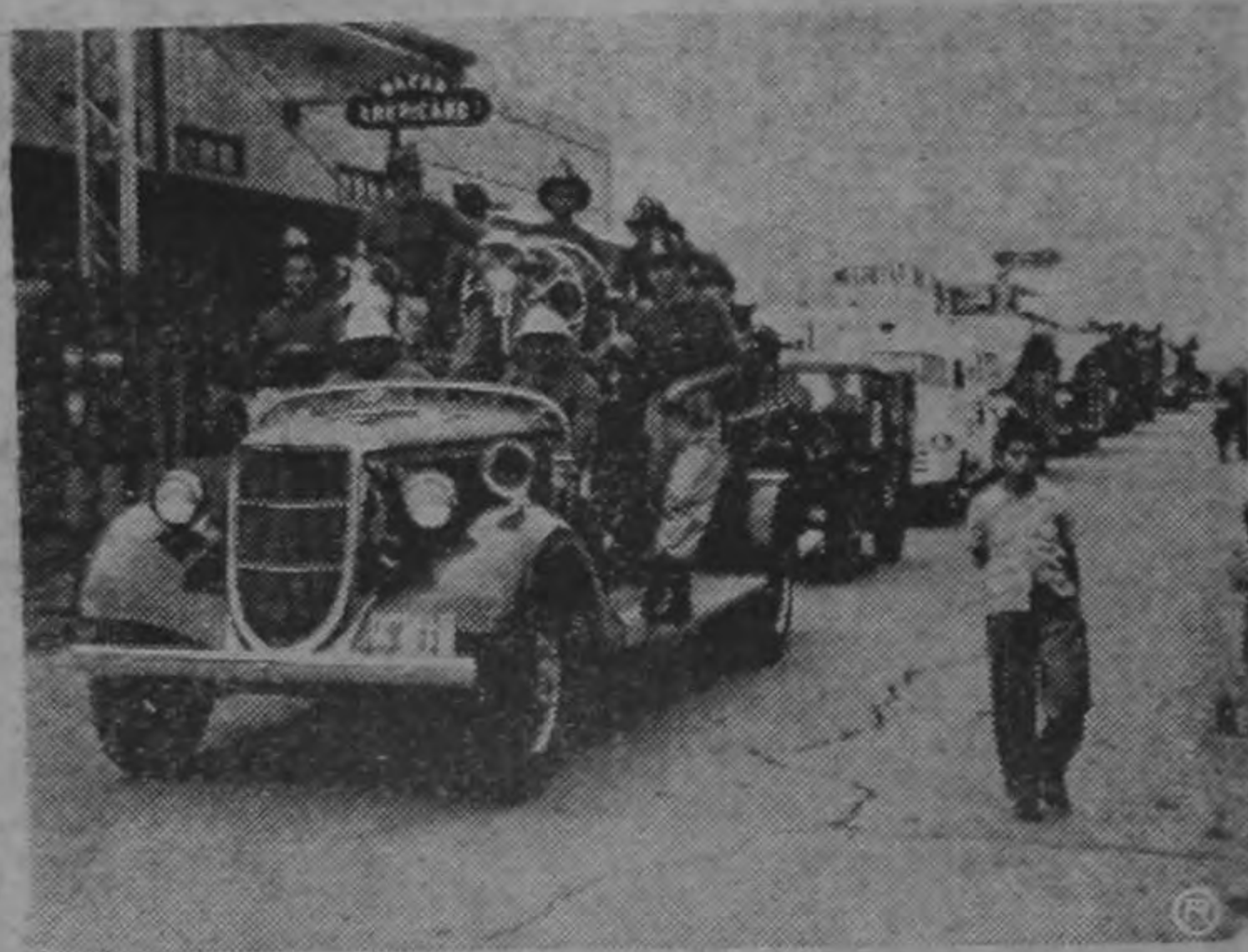
Un aspecto del tradicional desfile de camiones, carros y bombas, efectuado el domingo ante la Basílica de Nuestra Señora de los Angeles, en Cartago.

BUENOS AIRES 19, (USIS).— A partir de hoy, primero de setiembre, se permitirá que ingresen en la Argentina periódicos, revistas y libros publicados en los Estados Unidos. El ingreso fue prohibido en marzo de este año al exigir la Aduana licencias de importación y de divisas que expide el Banco Central para poder importar artículos.