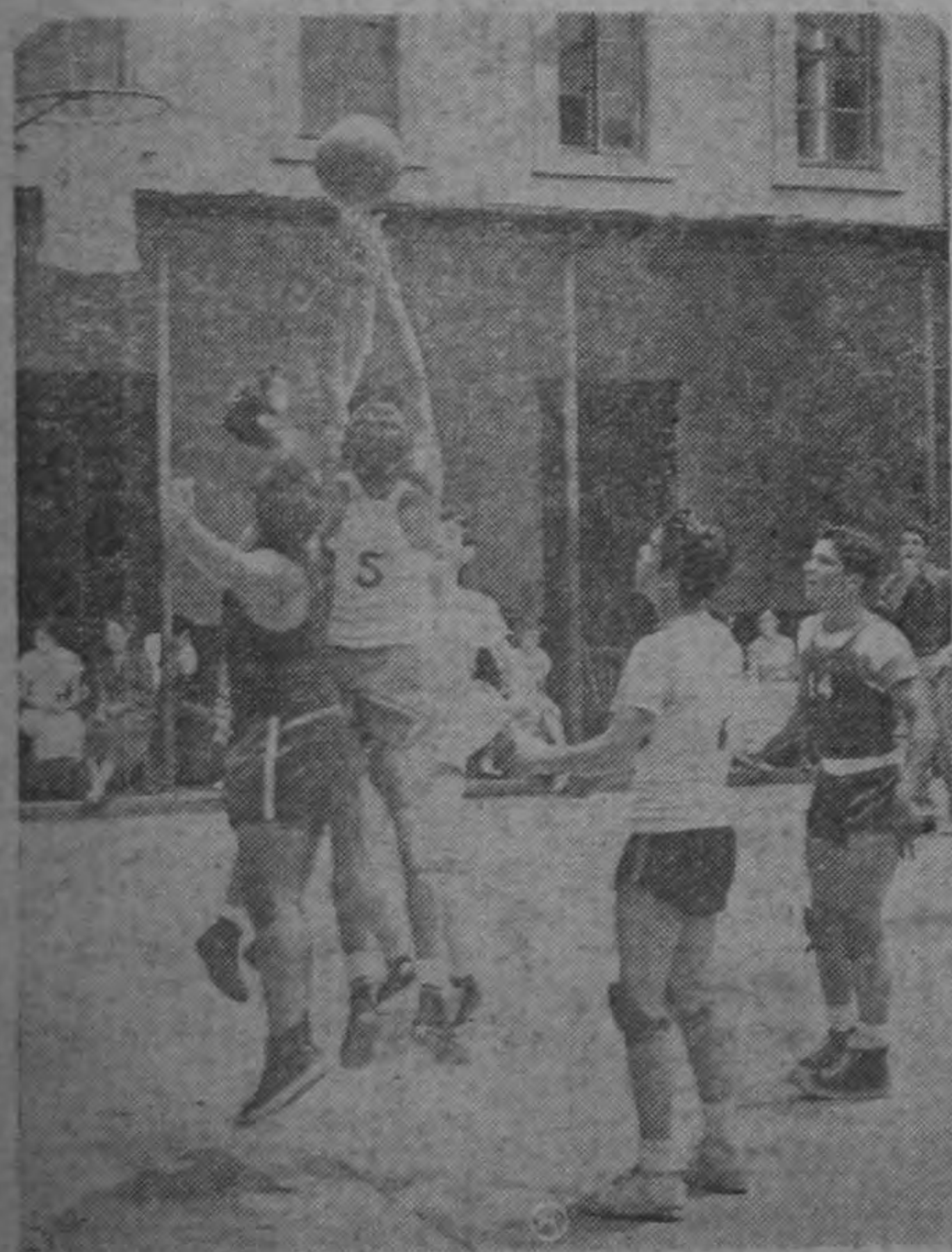
Escena culminante del partido final jugado entre los equipos de Cuarto y Quinto Años del Seminario, por el Campeonato de Basquetbol Intra-muros.