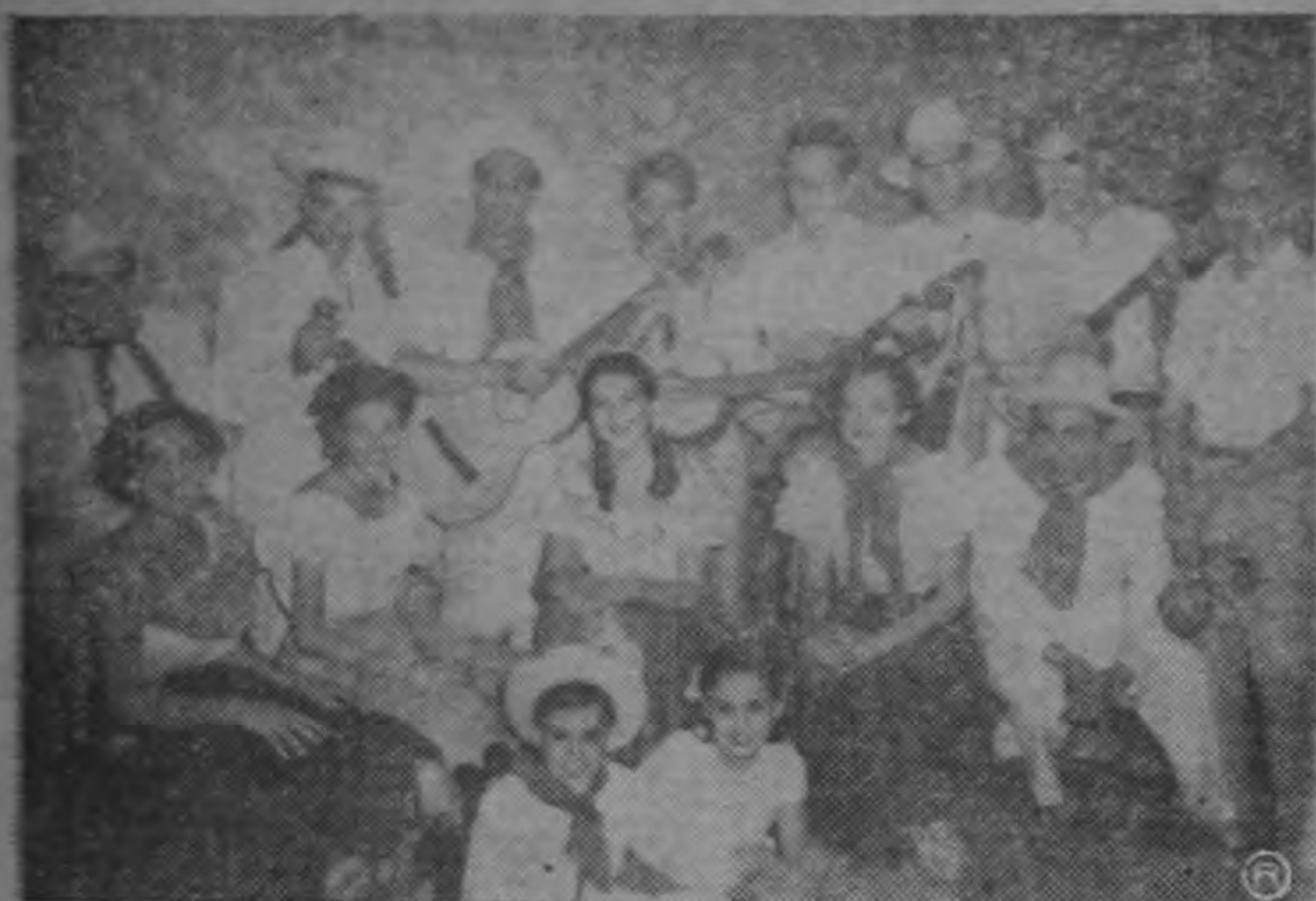
Conjunto de jóvenes venezolanos que actuaron el sábado en el Teatro Nacional, con números de música y bailes de su país, dentro del programa de coronación de la Reina de la Universidad, Matilde I.